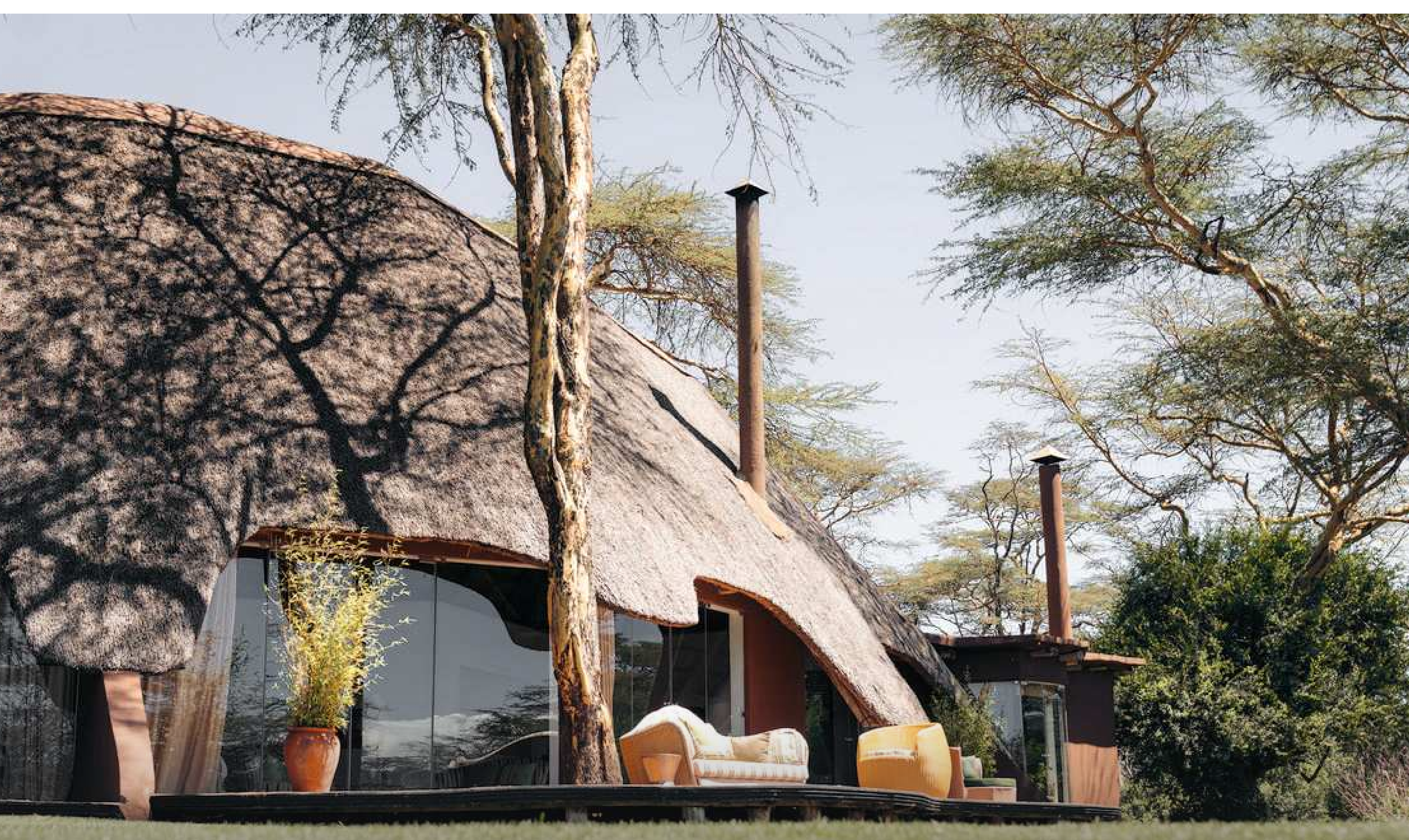
Solio Lodge 5*