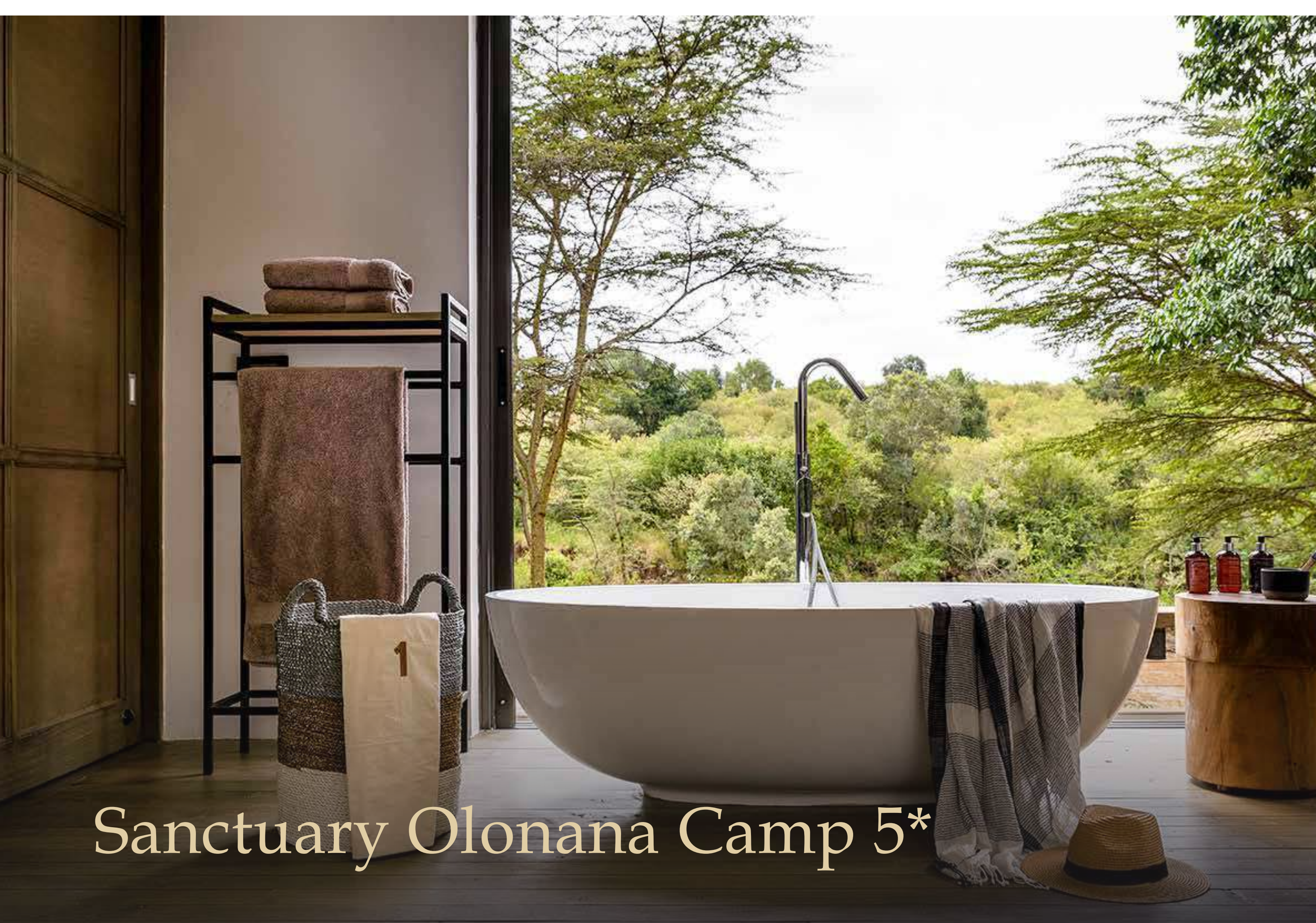
Sanctuary Olonana Camp 5*