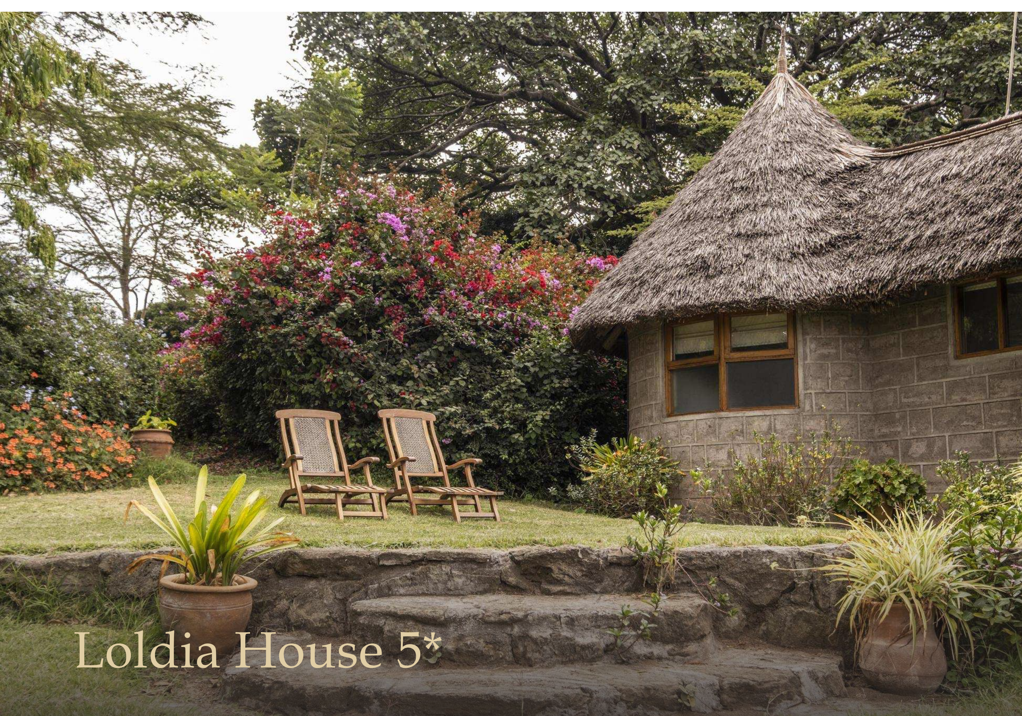
Loldia House 5*